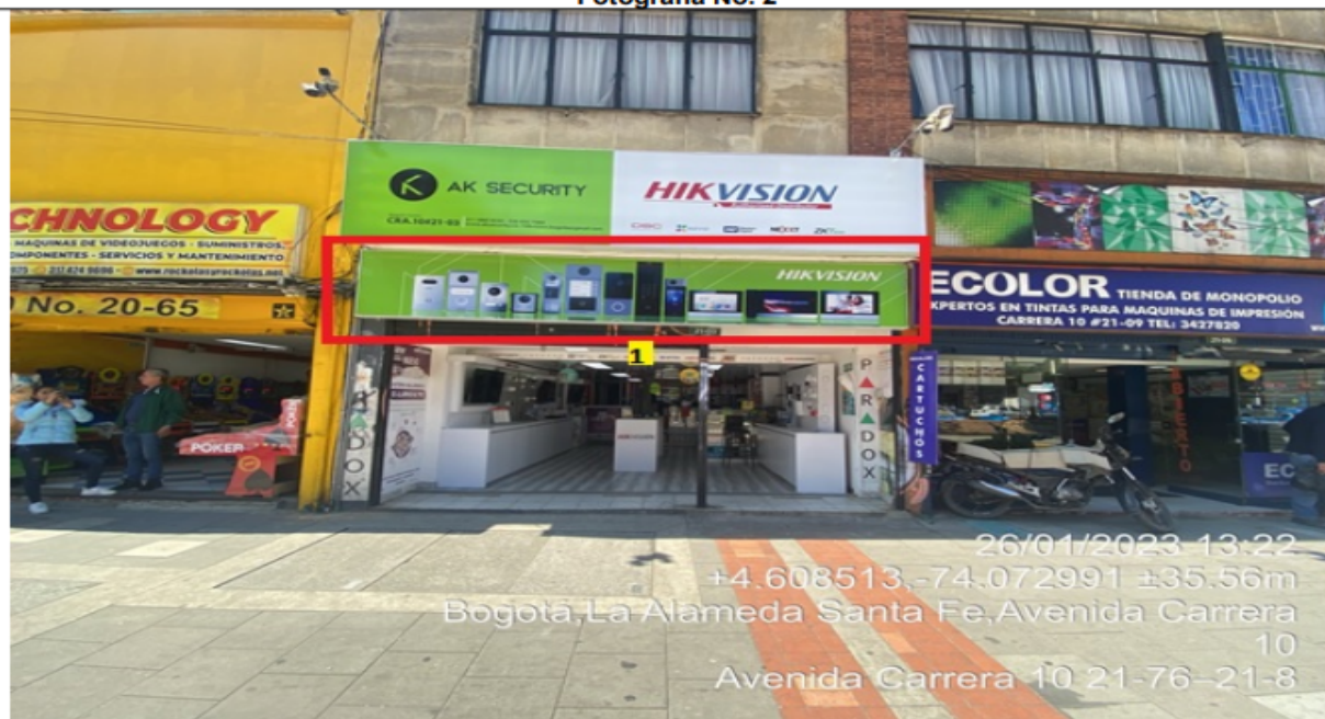
Fotografía No. 2

En la cual se evidencia un elemento tipo aviso en fachada perteneciente a la sociedad AK SECURITY SAS , el cual al momento de la visita se encontraba instalado sin el registro ante la SDA.